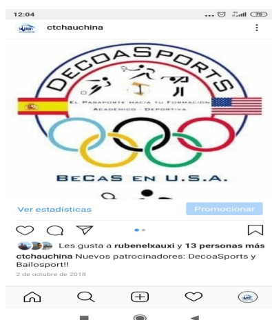
Visibilidad de los patrocinadores en redes sociales