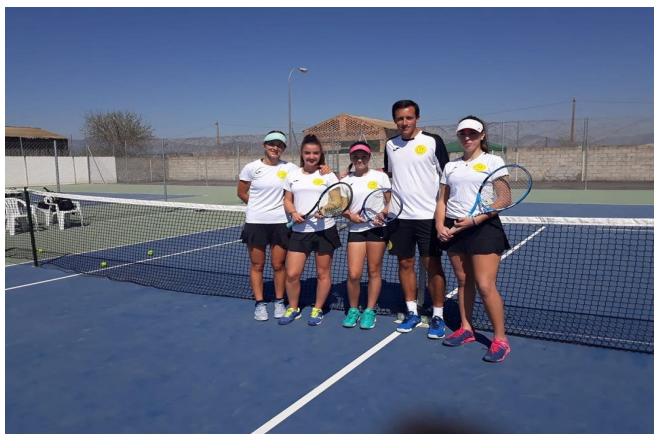
EQUIPO CADETE FEMENINO 2019