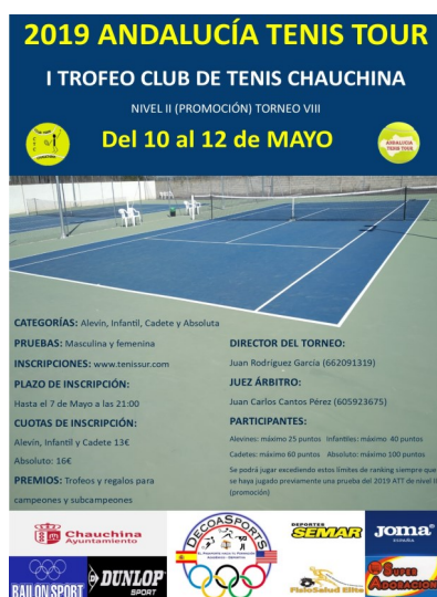
Visibilidad de los patrocinadores en el cartel de un torneo federado

Asimismo, la cantidad de torneos anuales y, por tanto, gente que mueve el club nos convierten en un atractivo para cualquier empresa que quiera colaborar en mayor o menor medida. Banners en los carteles, patrocinador principal de un torneo nacional, visibilidad en nuestras redes sociales y web, etc.