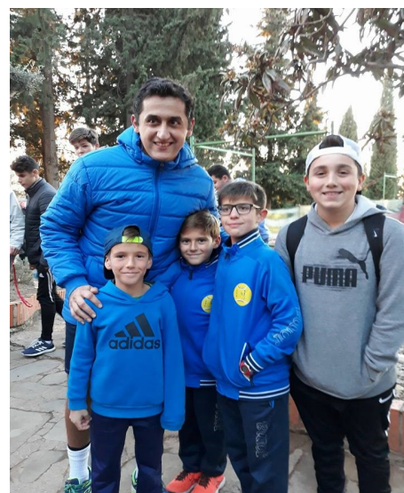
Nicolás Almagro (9 ATP)