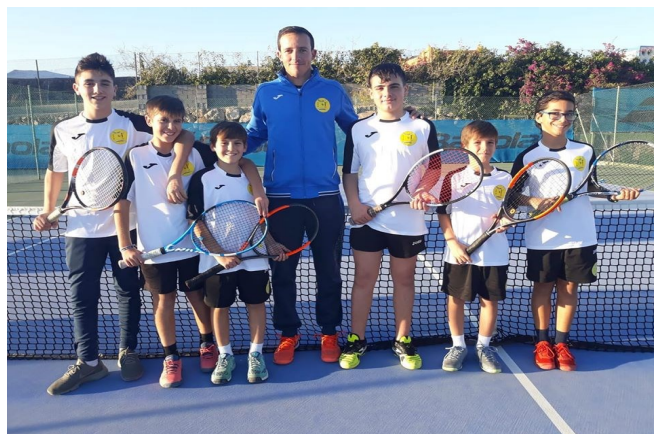
EQUIPO INFANTIL MASCULINO 2019