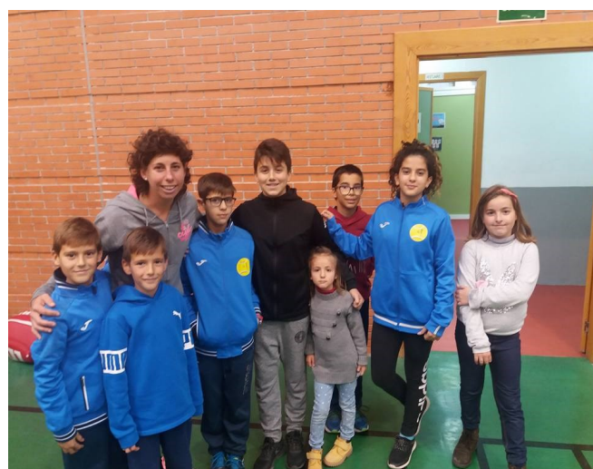
Carla Suárez (6 WTA)