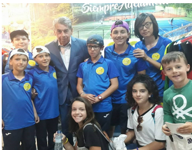
Manolo Santana (4 Gran Slam) Impulsor tenis español