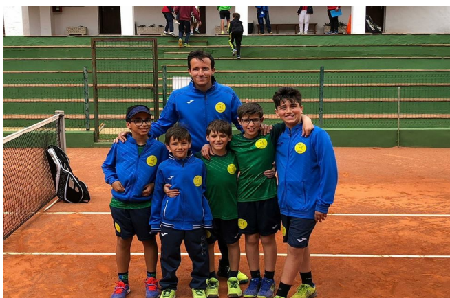
EQUIPO INFANTIL MASCULINO 2018