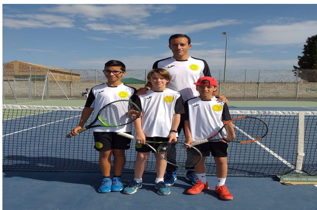
EQUIPO ALEVIN MASCULINO 2019