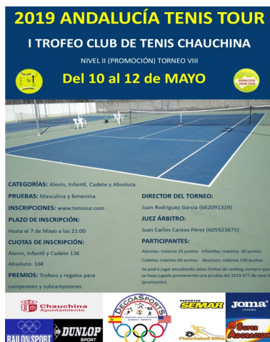
ANDALUCIA TENIS TOUR