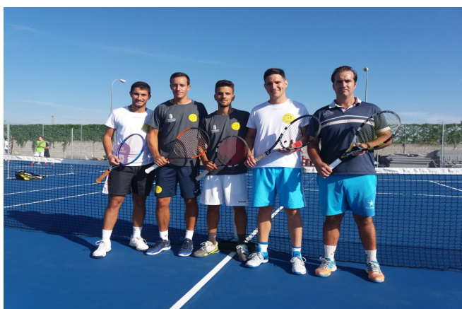
EQUIPO ABSOLUTO 2018