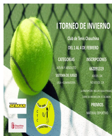
TORNEO DE INVIERNO