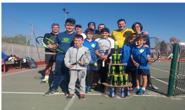
TORNEOS FEDERADOS Y NO FEDERADOS