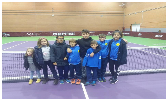
CAMPEONATO DE ESPAÑA Y MUTUA MADRID OPEN