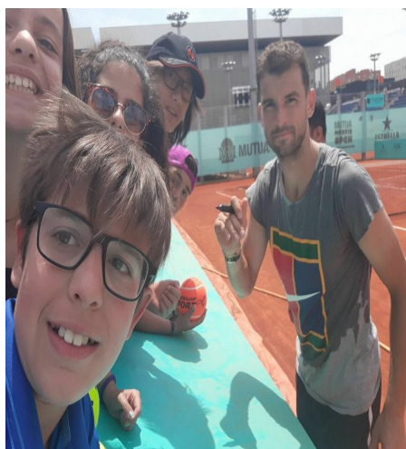
Grigor Dimitrov (3 ATP)