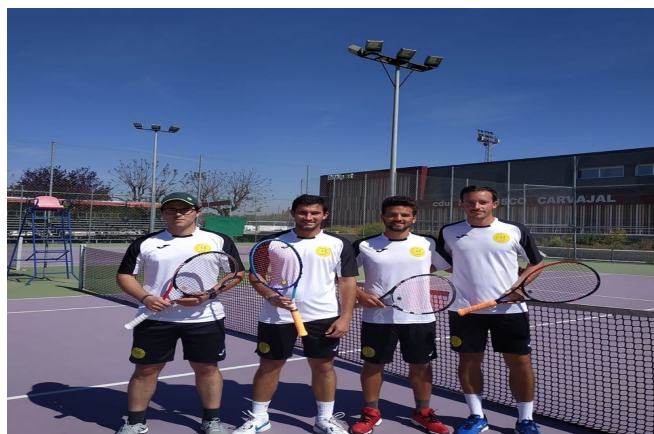
EQUIPO ABSOLUTO 2019