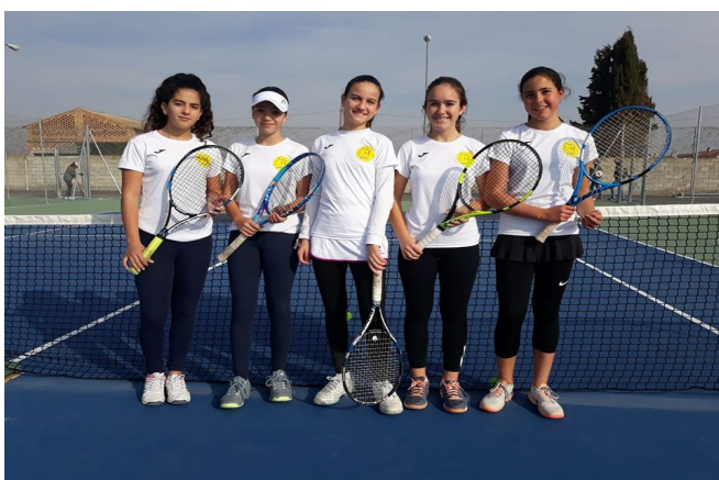
EQUIPO INFANTIL FEMENINO 2019