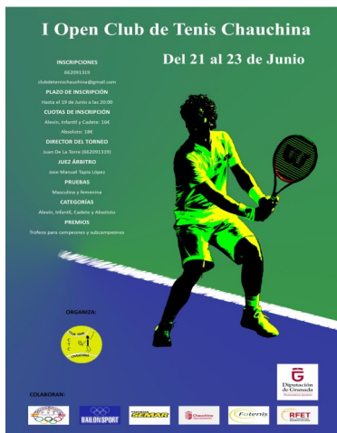
I OPEN CTCh