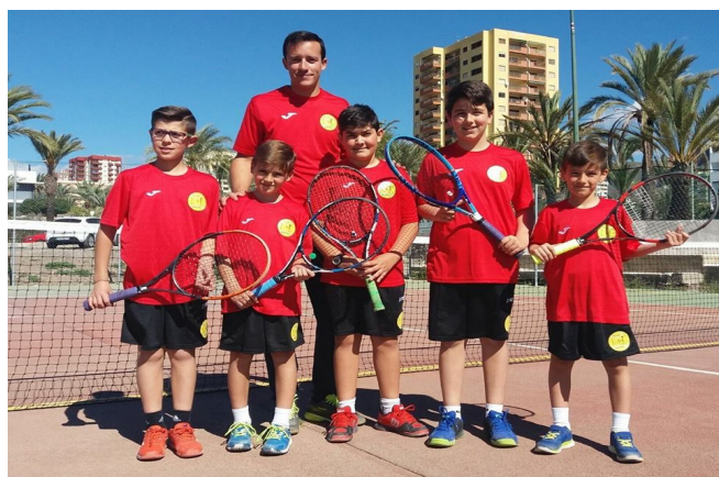
EQUIPO ALEVIN MASCULINO 2018